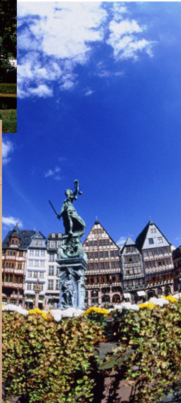
مجسمه یادبود گوتنه در فرانکفورت (بالا) ساختمان‌های قدیمی رومر (راست) و پوسنر نمایشگاه کتاب فرانکفورت در سال ۱۹۴۹