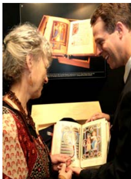
دومین نمایشگاه کتاب های قدیمی فرانکفورت

در کل، کتاب ها را می شود در نمایشگاه اهالی صنف کتاب فروخت. در برنامه های جنبی (تالارهای گفتگو) و در روز آخر نمایشگاه کتاب ها را می توان براساس قیمت ثابت متعارف به عموم مردم فروخت. در بخش کتاب های قدیمی فرانکفورت، کتاب های آنتیک که قیمت ثابت مشخصی ندارند، را می توان در هر زمانی در طول نمایشگاه فروخت.