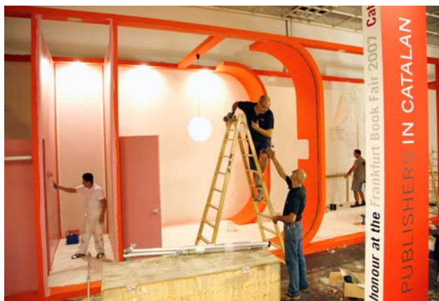
کارکنان نمایشگاه در حال آماده سازی غرفه ناشران کاتالان