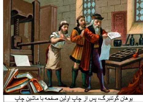
یوهان گوتنبرگ، پس از چاپ اولین صفحه با ماشین چاپ

نامه‌ای از یک بازدیدکننده در سال ۱۵۷۴، سندی است از اهمیت نمایشگاه در این قرن: در این نامه او به تحسین معرفی دانشمندان و نویسندگان در نمایشگاه، و مقایسه فضای آن با آتن باستان می‌پردازد. نمایشگاه فرانکفورت، خود را از سایر مکان‌های خرید و فروش کتاب متفاوت ساخته است. وقتی در همه جای آلمان به مارتین لوتر انگ بدعت گذار بودن چسبانده بودند، او می‌توانست نوشته‌هایش را در