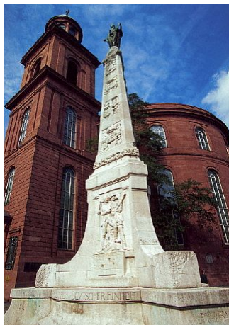
پاتولسکریشه، محل برگزاری اولین نمایشگاه پس از جنگ جهانی

با حمایت انجمن ناشران و کتابفروشان، اولین نمایشگاه کتاب در دوره پس از