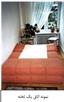
نمونه اتاق یک تخته

بازدیدکننده نمایشگاه اتاقی با حمام اختصاصی دارد. اتاق یک تخته شبی ۵۰ یورو اتاق دو تخته شبی ۷۵ یورو