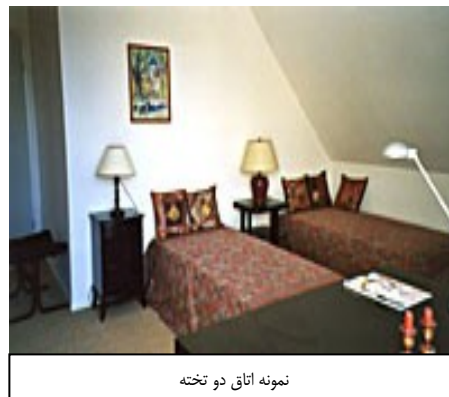
نمونه اتاق دو تخته