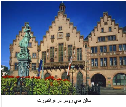
سالن های رومر در فرانکفورت

در دومین نمایشگاه کتاب فرانکفورت در سال ۱۹۵۰، به خاطر سالن‌های بزرگ رومر، شرکت کنندگان بین‌المللی هم